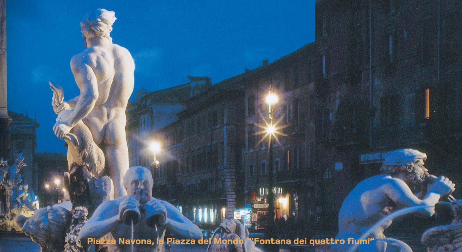
Piazza Navona, la Piazza del Mondo: "Fontana dei quattro fiumi"

Management S.r.l. - Viale Castrense, 7 - 00182 Roma